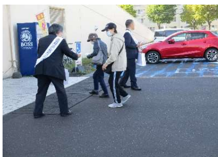
『年金支給日に合わせた啓発』

また、10月19日には、苫小牧市民会館で開催された第53回老人演芸大会にお邪魔し、リーフレット等を配布させていただきました。今後も消費者被害を未然に防止するため、積極的に啓発活動を行っていきます。