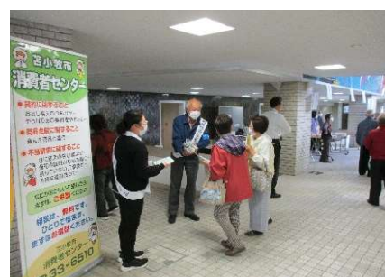
『老人演芸大会での啓発』

※『苫小牧市消費者被害防止ネットワーク』は、警察、消費生活、福祉及び教育の分野の関係機関・団体が協力・連携し、悪質商法・特殊詐欺などによる消費者被害の防止に資するための活動を行っています。